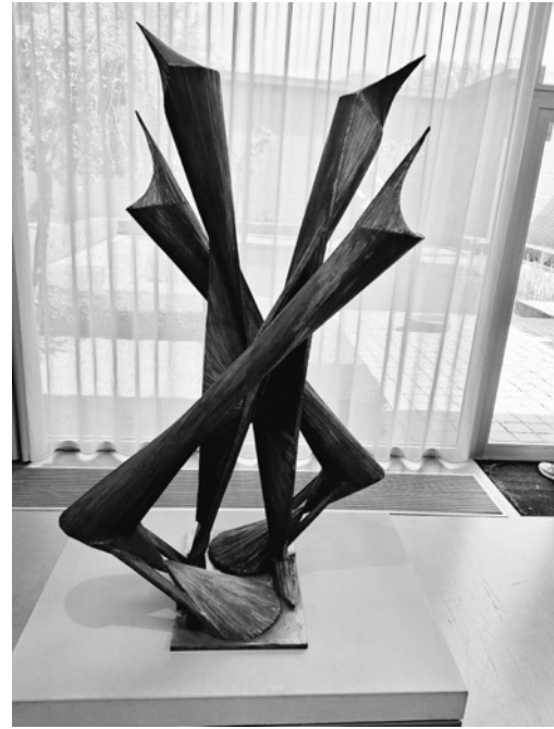
Zuil van Vrede Brons van Antoine Pevsner

Ik pleit ervoor de kerkorde te herschrijven met de zinsnede onopgeefbare verbondenheid met Israël . Dat zal voor de buitenstaander ook uitleg behoeven, maar dan gaat het wel direct om de kern van de zaak. Bij Israël gaat het voor de kerk niet om de staat Israël, die pas sinds 1948 bestaat, niet om het volk Israël, een louter verwarrend stichtende term, en ook niet om het land Israël, omdat dat niet anders is dan de geografische aanduiding van een omstreken stukje van de aardbol. Als de kerk, die belijdt dat Jezus haar Heer is, spreekt van Israël, dan zal het dus gaan om het Israël, zoals dat voor Jezus betekenis heeft gehad. Het Israël, zoals Jezus dat heeft leren kennen in de synagoge uit de geschriften van Mozes en de profeten en dat voor hem de leerschool is geweest. Het Israël dat volgens de evangelisten de spiegel was, waarin Jezus zichzelf heeft begrepen in zijn beroep op de geschriften die wij doorgaans aanduiden met Oude Testament.