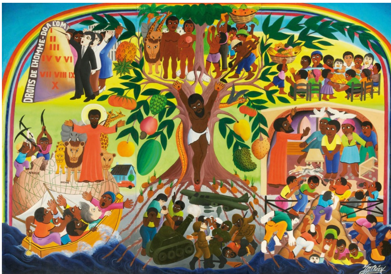
Hongerdoek door Jacques-Richard Chery, 1982